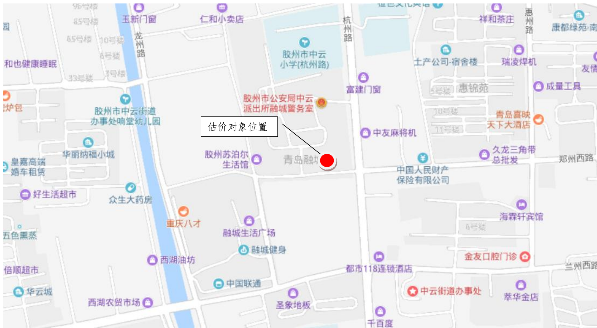
估价对象区域位置