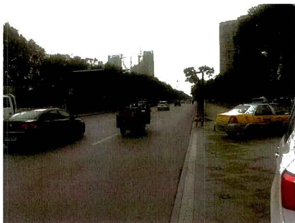
估价对象周边道路一