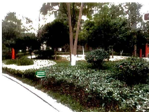
估价对象内部环境