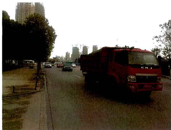
估价对象周边道路二