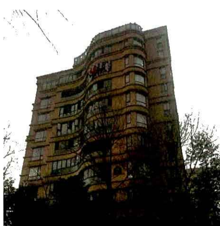
估价对象整体外观