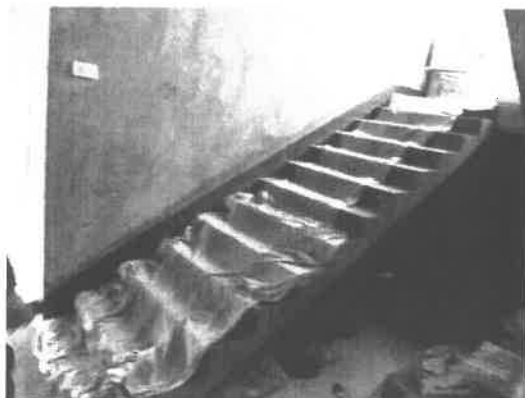
笔架山办事处东方大道锦霞居民小区房屋楼梯