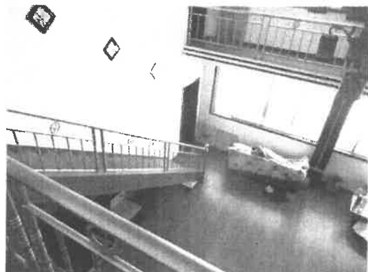
石首市绣林办事处新建路 54 号房屋二至三层