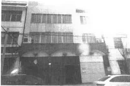
石首市绣林办事处新建路 54 号房屋正面