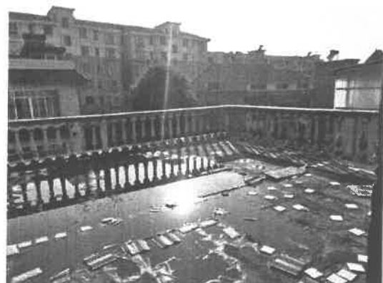
笔架山办事处东方大道锦霞居民小区房屋二层露台