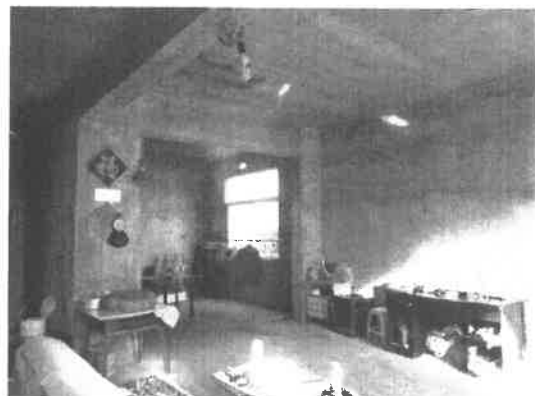
笔架山办事处东方大道锦霞居民小区房屋一层