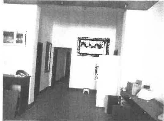
石首市绣林办事处新建路 54 号房屋一层