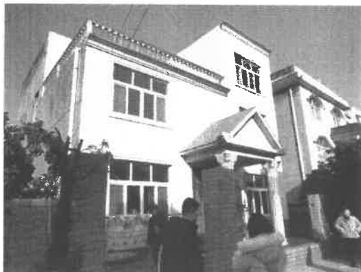
笔架山办事处东方大道锦霞居民小区房屋正面