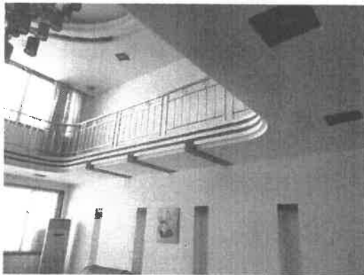
石首市绣林办事处新建路 54 号房屋二至三层