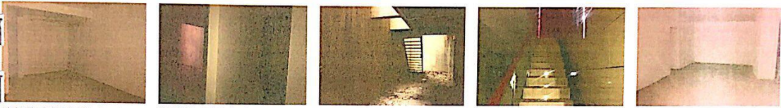
地凯旋广场住宅 (14) .JPG 地凯旋广场住宅 (15) .JPG 地凯旋广场住宅 (16) .JPG 地凯旋广场住宅 (17) .JPG 地凯旋广场住宅 (18) .JPG