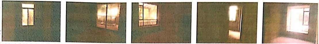
地凯旋广场住宅 (4) .JPG 地凯旋广场住宅 (5) .JPG 地凯旋广场住宅 (6) .JPG 地凯旋广场住宅 (7) .JPG 地凯旋广场住宅 (8) .JPG