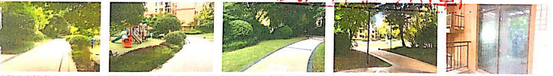
地凯旋广场住宅 (24) .JPG 地凯旋广场住宅 (25) .JPG 地凯旋广场住宅 (26) .JPG 地凯旋广场住宅 (27) .JPG 地凯旋广场住宅 (3) .JPG