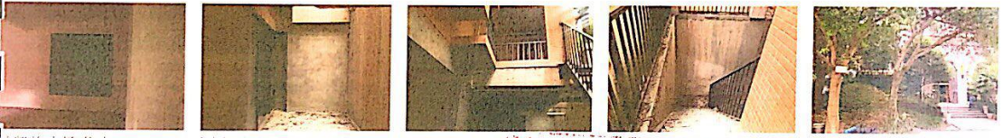
地凯旋广场住宅 (19) .JPG 地凯旋广场住宅 (20) .JPG 地凯旋广场住宅 (21) .JPG 地凯旋广场住宅 (22) .JPG 地凯旋广场住宅 (23) .JPG