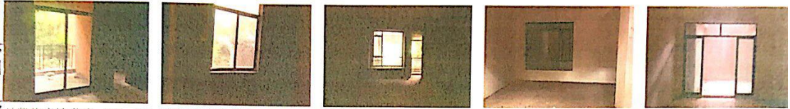
地凯旋广场住宅 (9) .JPG 地凯旋广场住宅 (10) .JPG 地凯旋广场住宅 (11) .JPG 地凯旋广场住宅 (12) .JPG 地凯旋广场住宅 (13) .JPG