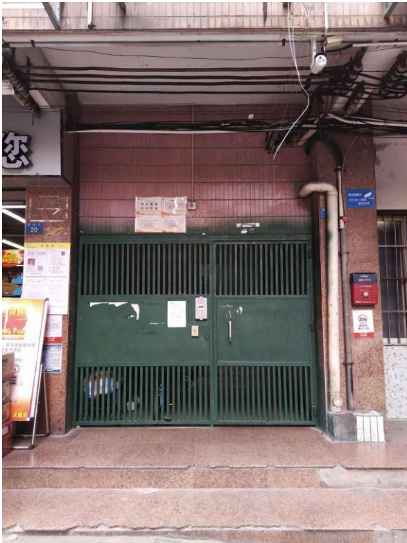
标的所在楼宇入口