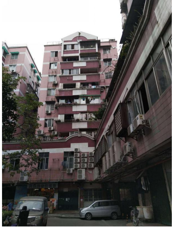
标的所在楼宇外观