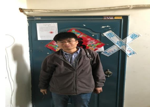
注册估价师现场照片