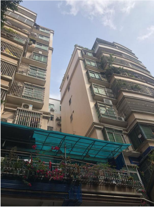
标的所在楼宇外观