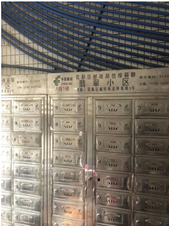
标的所在楼宇邮箱