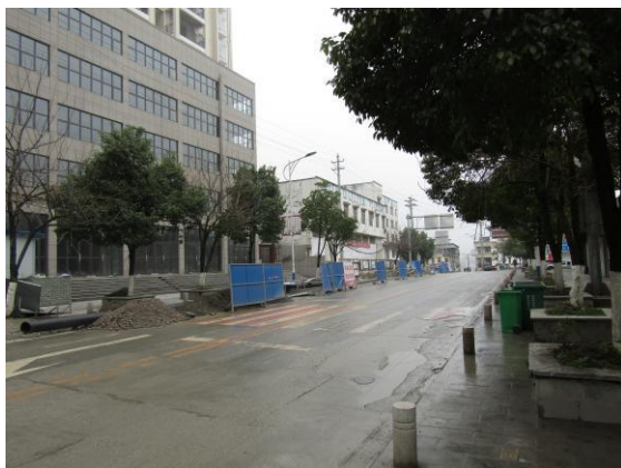
估价对象临路状况 (G209 国道)