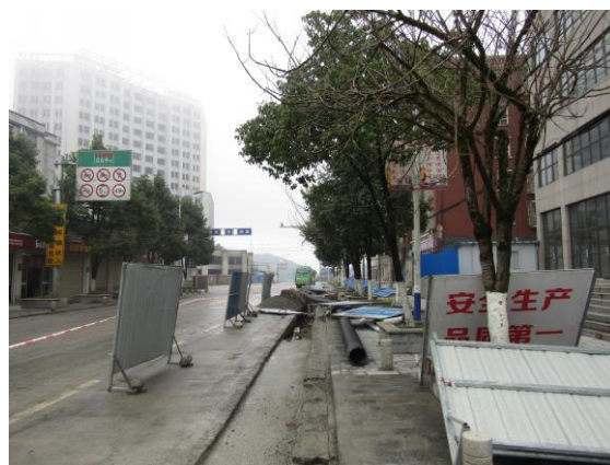
估价对象临路状况 (G209 国道)