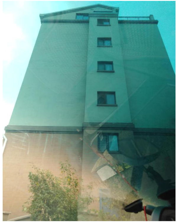
标的所在楼宇外观