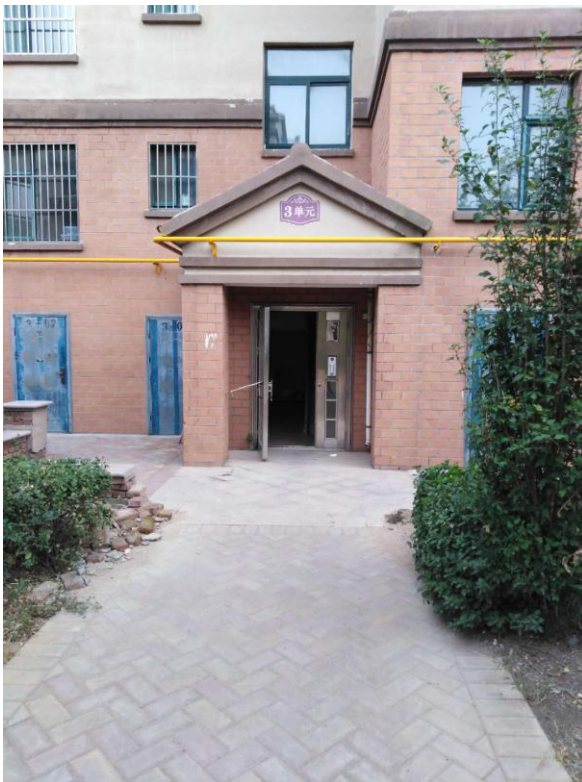
标的所在楼宇入口