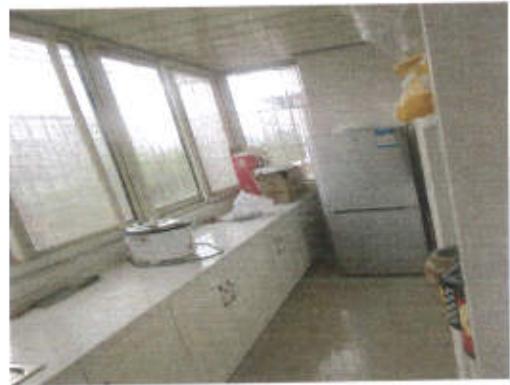
估价对象利用现状照片