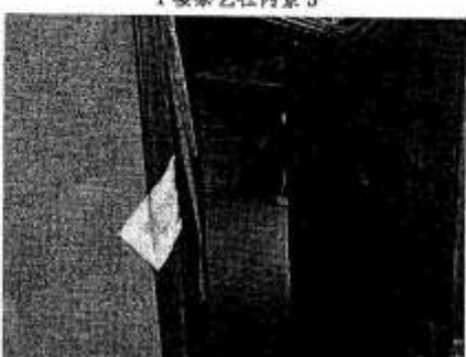
3楼毛坯房入户大门