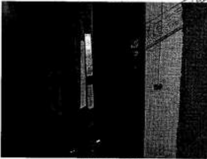
3楼装修房入户大门